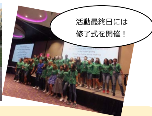
活動最終日には 修了式を開催！