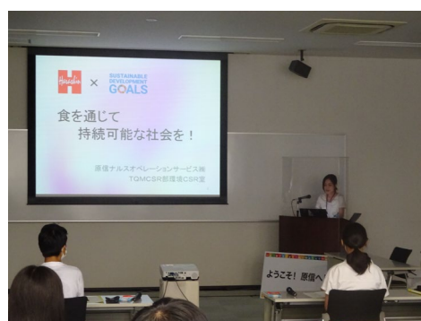
原信様の取り組み紹介 (イメージ)